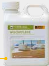
Weitzer Parkett ProVital Wischpflege